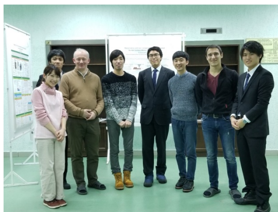
(2017年12月カザン連邦大学での交流風景)